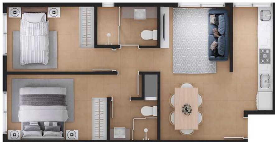
Planta 1 59,67 M 2