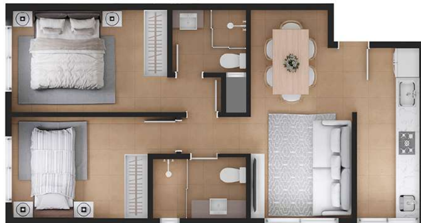
Planta 2 57,82 M 2