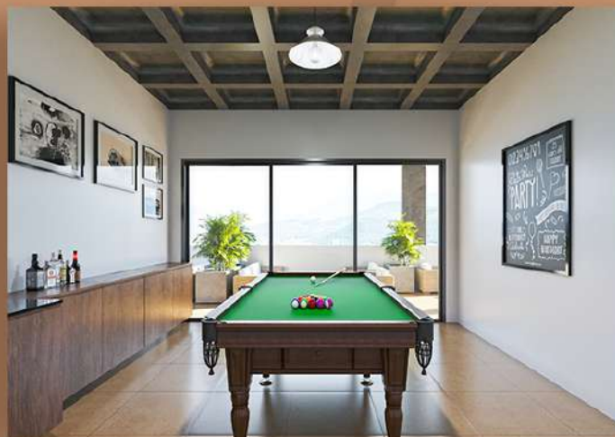
Sala de Jogos